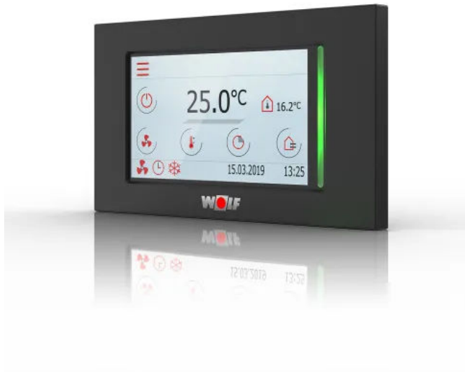
Bedienmodul BMK Touch

Durch die intuitiven Bedienmodule BMK Touch und BMK T10 ist die Smart Home-Vernetzung per App der Klima- und Lüftungssysteme möglich.