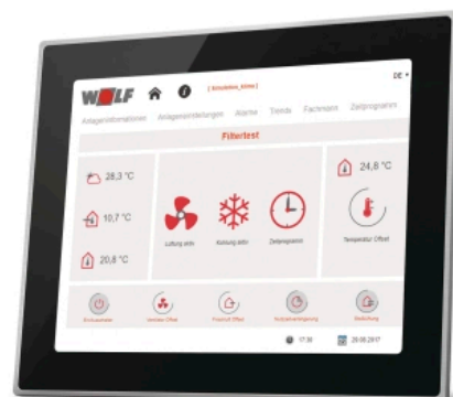
Bedienmodul BMK T10