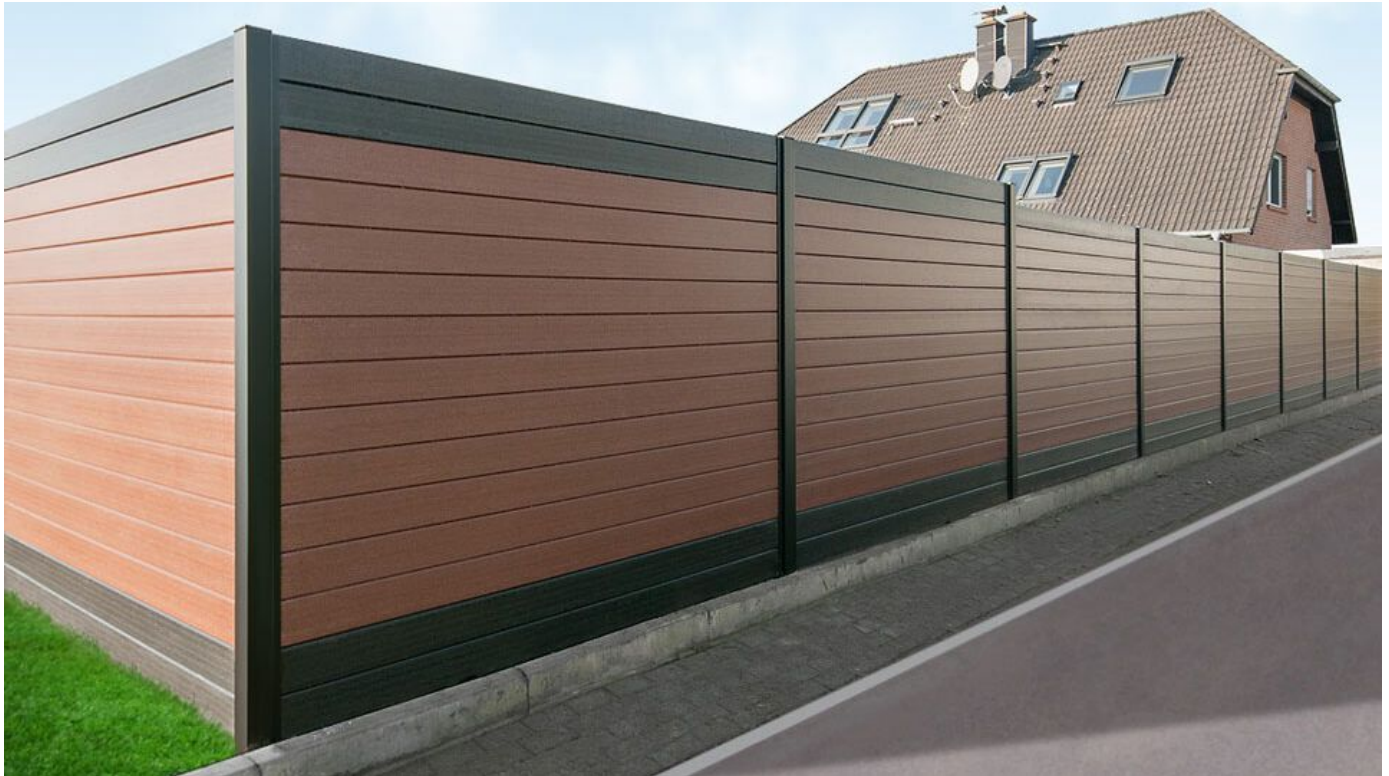
ThomTek® Perilux schalldämmende Konstruktion als Schallschutzzaun und als Schallschutzwand

Aus der Serie WPC-Schallschutzelemente NaturinForm von NaturinForm