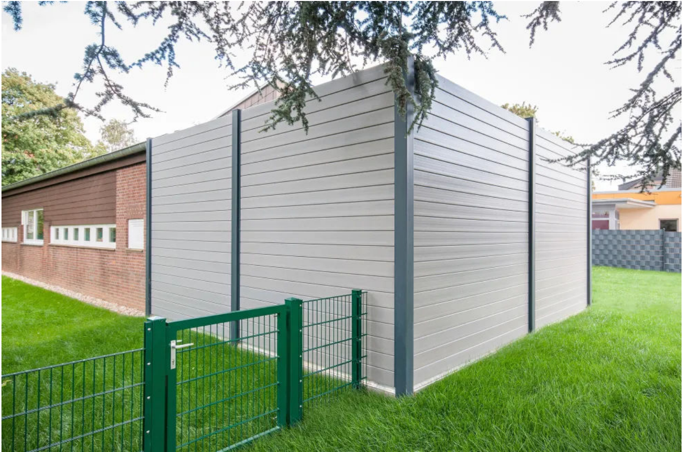
Städtische Tageseinrichtung für Kinder St. Antonius, Eschweiler