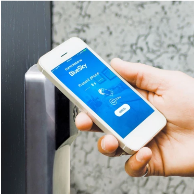
790/RT RFID und BlueSky Access

Aus der Serie Hotelzutrtrittssysteme von dormakaba