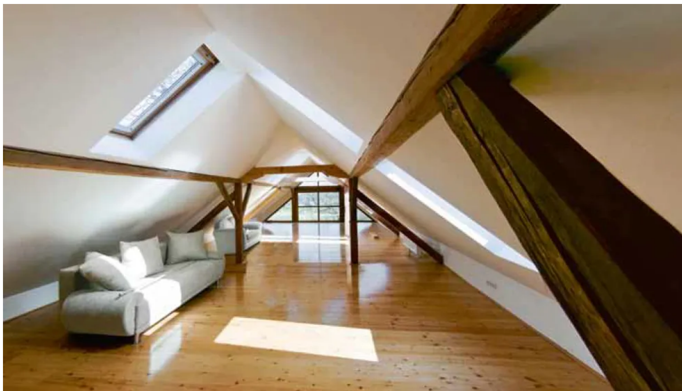
Integra UKF - 032

Aus der Serie ISOVER- Mineralische Dämmsysteme, Luftdichtheit- und Feuchteschutzsysteme von SAINT-GOBAIN ISOVER